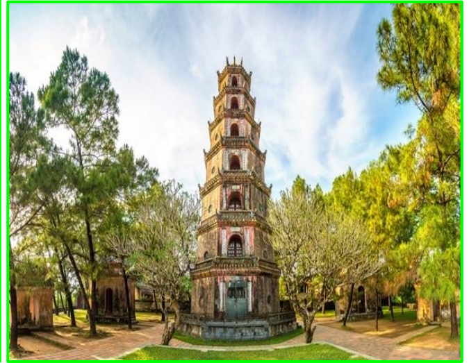
วัดเจติยเถียนมู