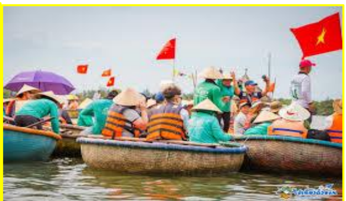
เรือกระดังง์