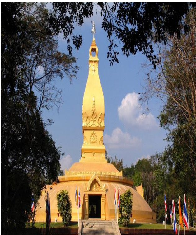
วัดหนองป่าพง