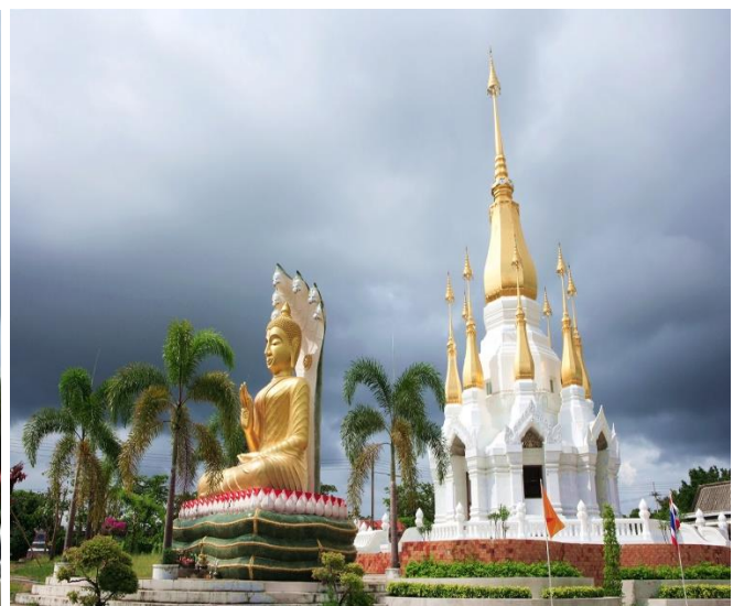
วัดถ้ำคูหาสวรรค์