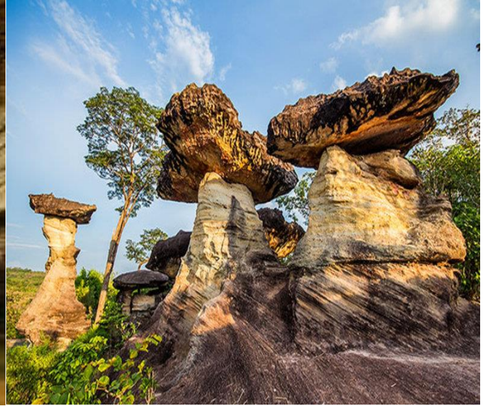
เสาเฉลียง