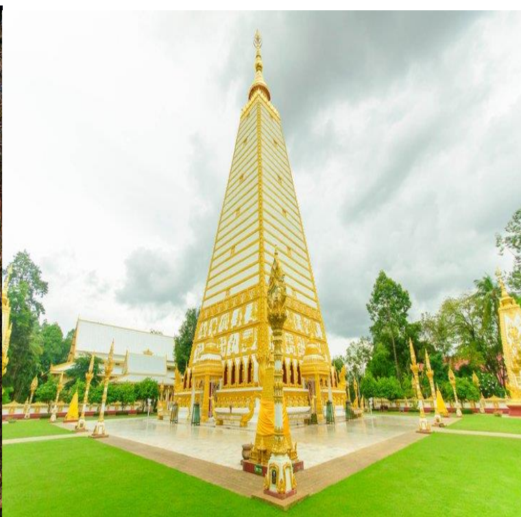
วัดพระธาตุหนองบัว