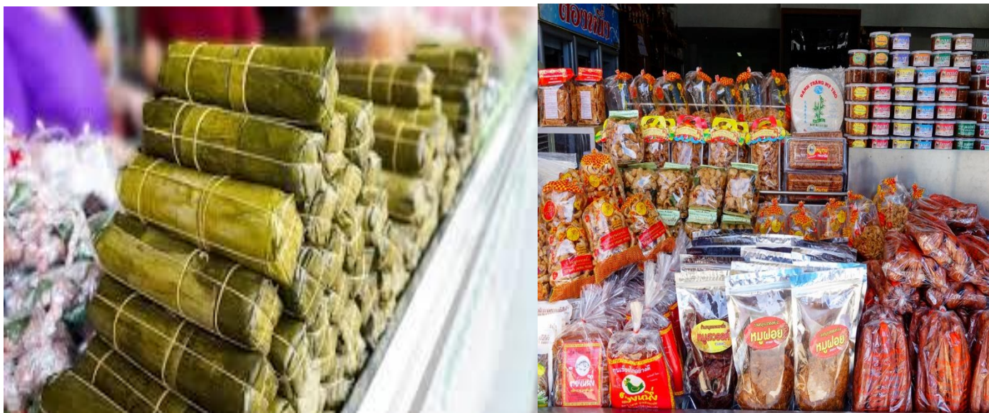
ของฝากเมืองอุบลฯ