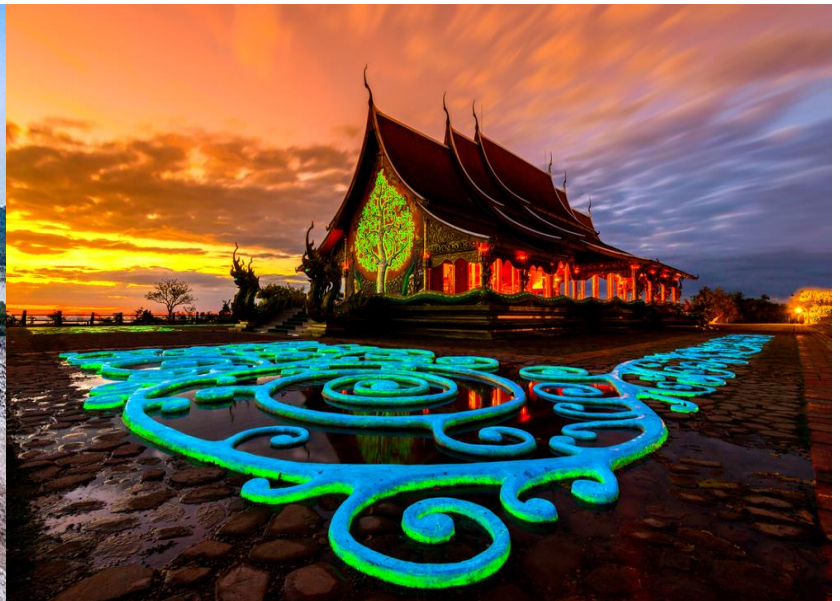
วัดสิรินธรวรารามภูพร้าว (วัดเรืองแสง)

ทัวร์วันที่สอง : แม่น้ำสองสี - วัดถ้ำคูหาสวรรค์ - อุทยานแห่งชาติแก่งตะนะ - เขื่อนปากมูล - อ้อมกอดแห่งบ้านนา ทุ่งนามือปราบ จอนนีฟาร์มสเตย์ - วัดพระธาตุหนองบัว - วัดหนองป่าพง - กลุ่มพัฒนาสตรีผ้าไทยอุบลฯ ซื้อของฝากเมืองอุบลฯ