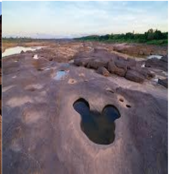
สามพันโบก