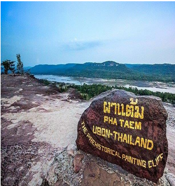
อุทยานแห่งชาติผาแต้ม