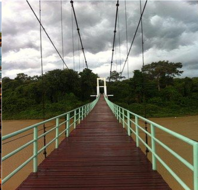
สะพานแขวนแก่งตะนะ