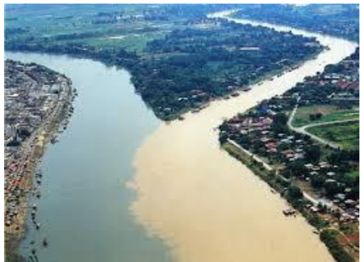
แม่น้ำสองสี