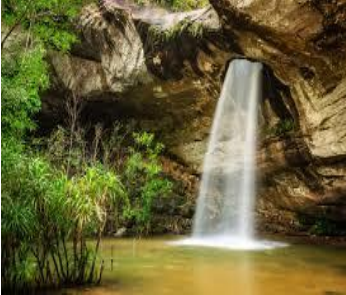
น้ำตกแสงจันทร์ (น้ำตกलगงู)

Website : www.samridtour.com / www.รถเช่าอุบลและทัวร์.com