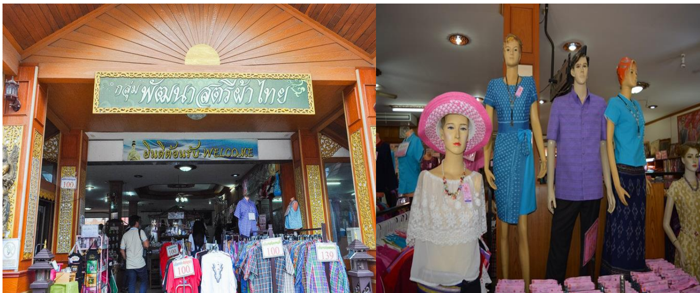
กลุ่มพัฒนาสตรีผ้าไทยอุบลราชธานี

Website : www.samridtour.com / www.รถเช่าอุบลและทัวร์.com